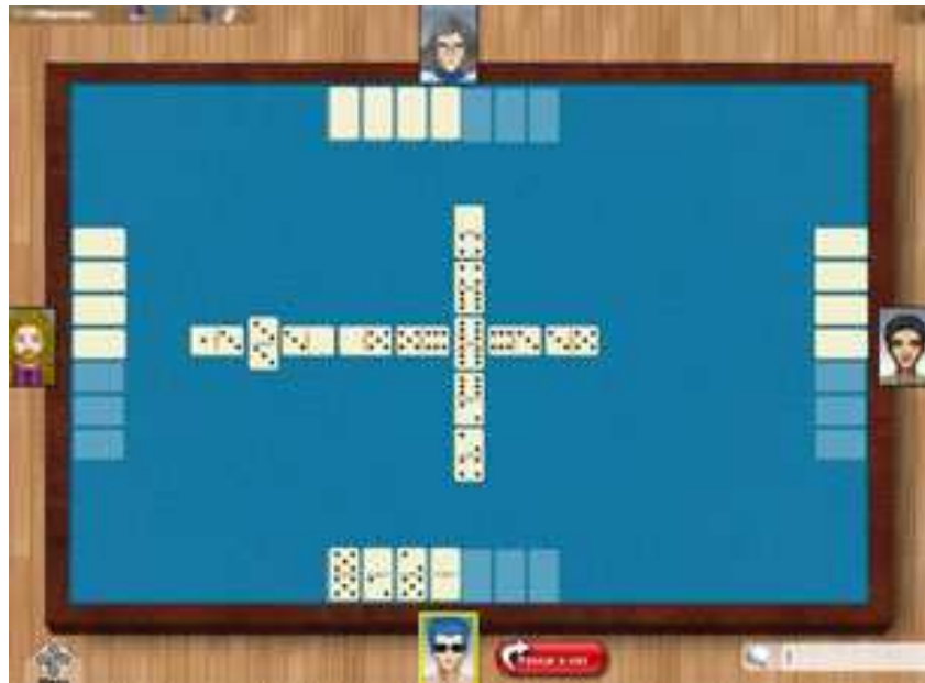
Figura 03: simulação de jogo em “andamento”

16. Na situação simulada no tabuleiro da figura 03, dada a seguir, quatro pessoas estão jogando entre si, individualmente. Salazar é o jogador indicado pelo personagem de óculos na parte inferior desta figura, e suas pedras estão visíveis a você. Doze peças com naipes desconhecidos estão distribuídas entre os demais jogadores.