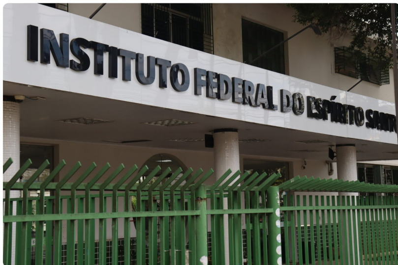
Com 22 campi, incluindo Vitória, o Instituto Federal do ES (Ifes) vai ganhar mais uma unidade.