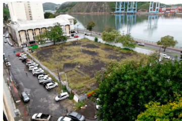
Terreno cedido para o Ifes. Imóvel, no passado, foi cogitado para a construção de um shopping no Centro de Vitória.

O projeto do Instituto Federal do Espírito Santo (Ifes) de levar para os Galpões do IBC, em Jardim da Penha, algumas de suas unidades - educacionais e administrativas - , não foi aceito pela Secretaria de Patrimônio da União (SPU), que optou por vender o imóvel. Mas em troca foi confirmada a cessão de um terreno no Centro de Vitória, com prorrogação do prazo do contrato.