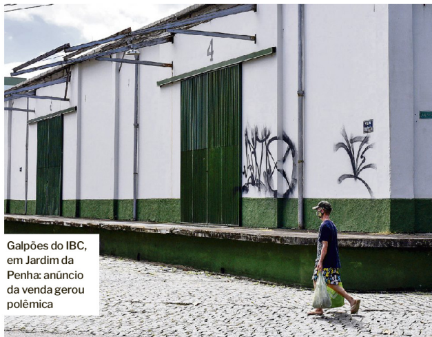
Galpões do IBC, em Jardim da Penha: anúncio da venda gerou polêmica