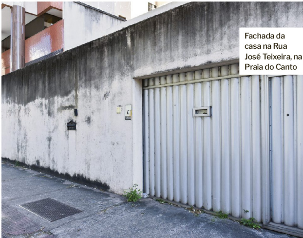
Fachada da casa na Rua José Teixeira, na Praia do Canto