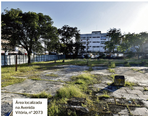
Área localizada na Avenida Vitória, nº 2073