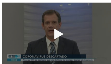
Caso suspeito de Coronavírus de estudante do Ifes que voltou da China é descartado, no ES

Uma turma do Instituto Federal do Espírito Santo (Ifes) de Cachoeiro de Itapemirim, no Sul do Estado, teve as aulas suspensas nesta quarta-feira (19) por causa da suspeita de que uma estudante estivesse contaminada com coronavírus. A jovem voltou da China há pouco tempo, depois que a doença já havia começado a aparecer no país.