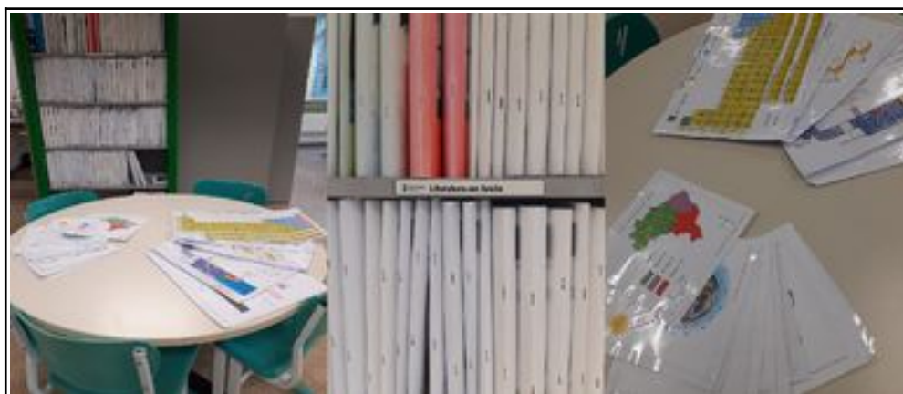
Figura 2 – Espaço acessível

Um atendimento individual é feito ao aluno, conforme sua necessidade, como no caso citado, em que acompanhamos o aluno cadeirante para pegar os livros que ficam nas prateleiras superiores.